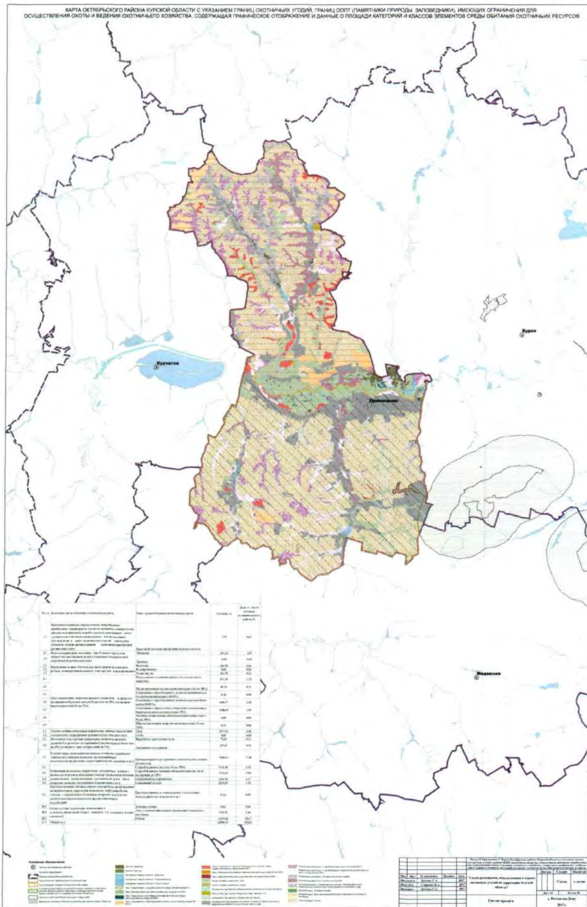
КАРТА ОКТЯБРЬСКОГО РАЙОНА КУРСКОЙ ОБЛАСТИ С УКАЗАНИЕМ ГРАНИЦ ОХОТНИЧЬИХ УГОДИЙ, ГРАНИЦ ООПТ (ПАМЯТНИКИ ПРИРОДЫ, ЗАПОВЕДНИКИ), ИМЕЮЩИХ ОГРАНИЧЕНИЯ ДЛЯ ОСУЩЕСТВЛЕНИЯ ОХОТЫ И ВЕДЕНИЯ ОХОТНИЧЬЕГО ХОЗЯЙСТВА, СОДЕРЖАЩАЯ ГРАФИЧЕСКОЕ ОТРАЖЕНИЕ И ДАННЫЕ О ПЛОЩАДИ КАТЕГОРИИ И КЛАССОВ ЭЛЕМЕНТОВ СРЕДЫ ОБИТАНИЯ ОХОТНИЧЬИХ РЕСУРСОВ