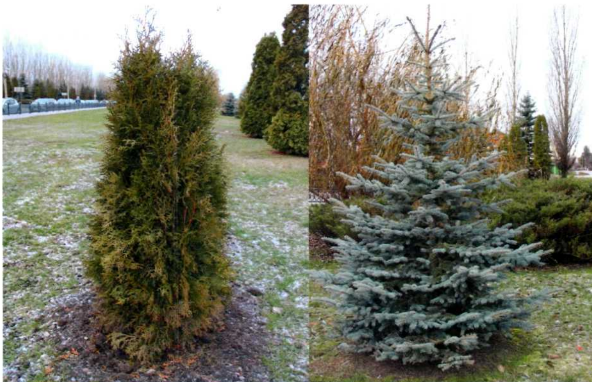
Фото 7. Туя западная