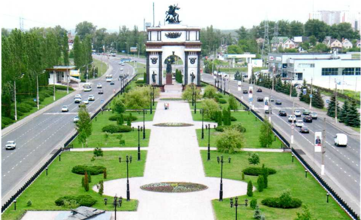
Фото 1. Общий вид природного парка