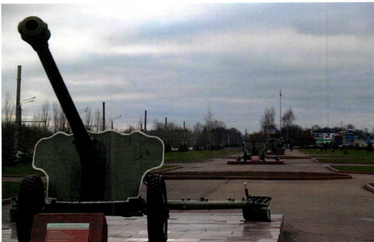
Фото 3. Аллея военной техники