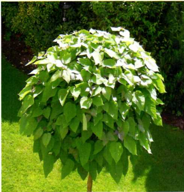
Фото 5. Катальпа бегониевидная