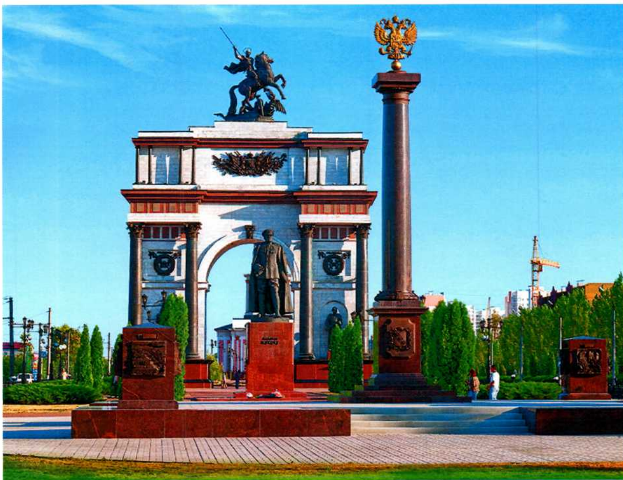
Фото 2. Памятник маршалу Г.К. Жукову