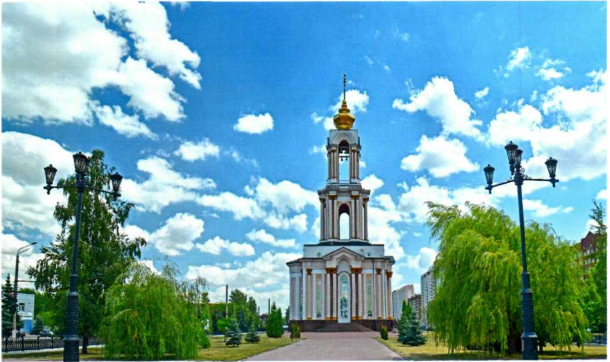
Фото 4. Общий вид храма Святого Великомученика Георгия Победоносца