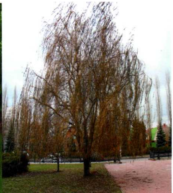
Фото 6. Ива вавилонская