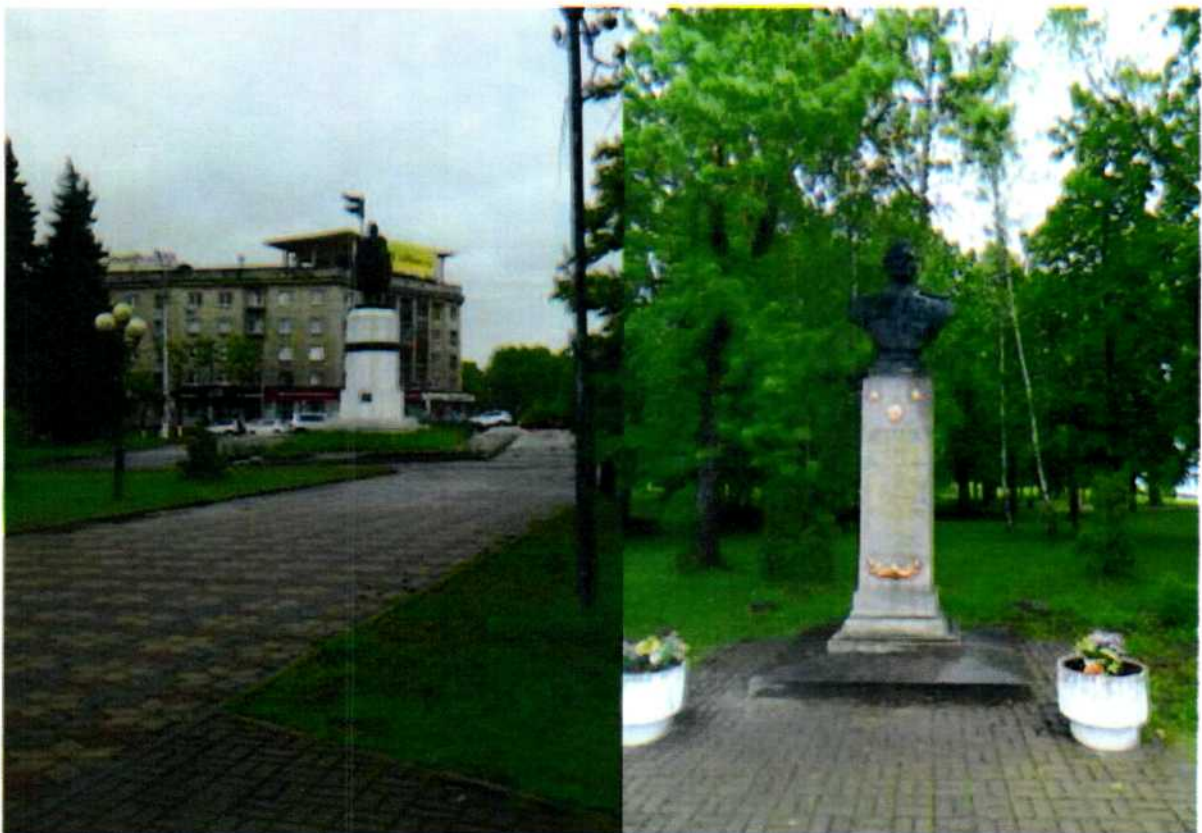
Фото 2. Центральная аллея