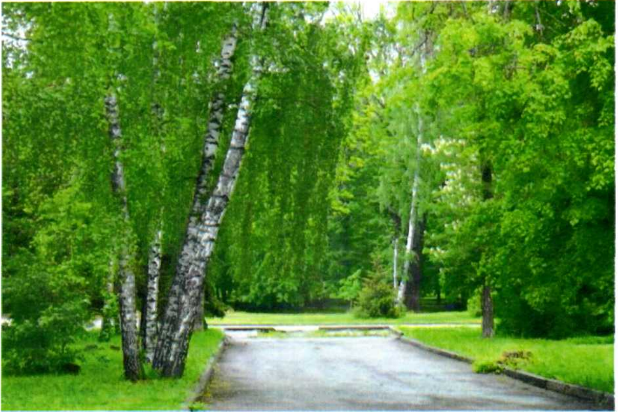
Фото 4. Берёза повислая