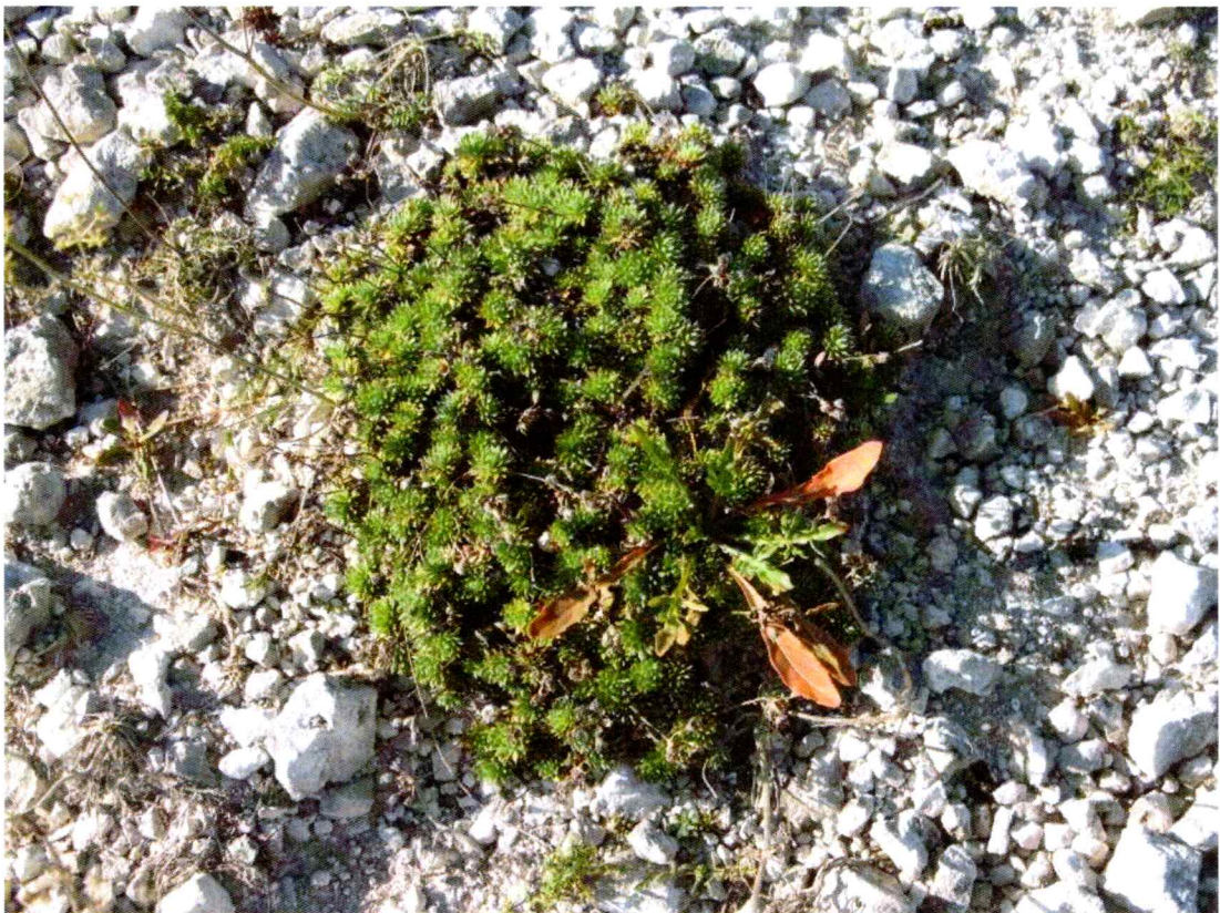
Фото 3. Проломник Козо-Полянского