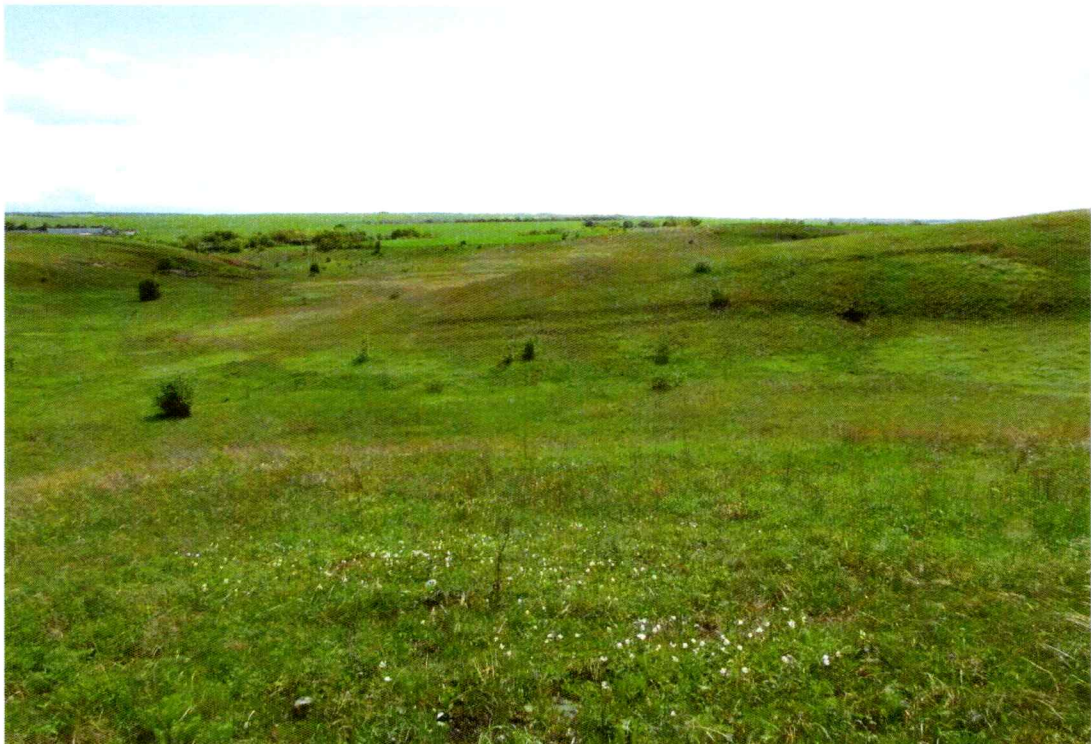
Фото 1. Общий вид