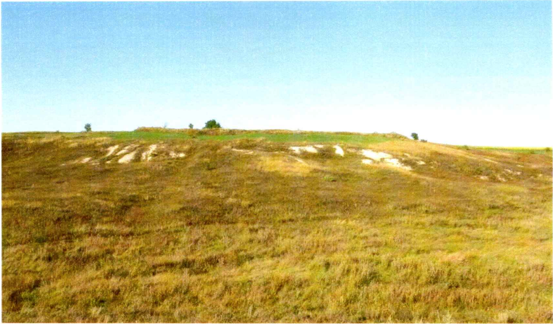
Фото 2. Выходы мела по склону балки