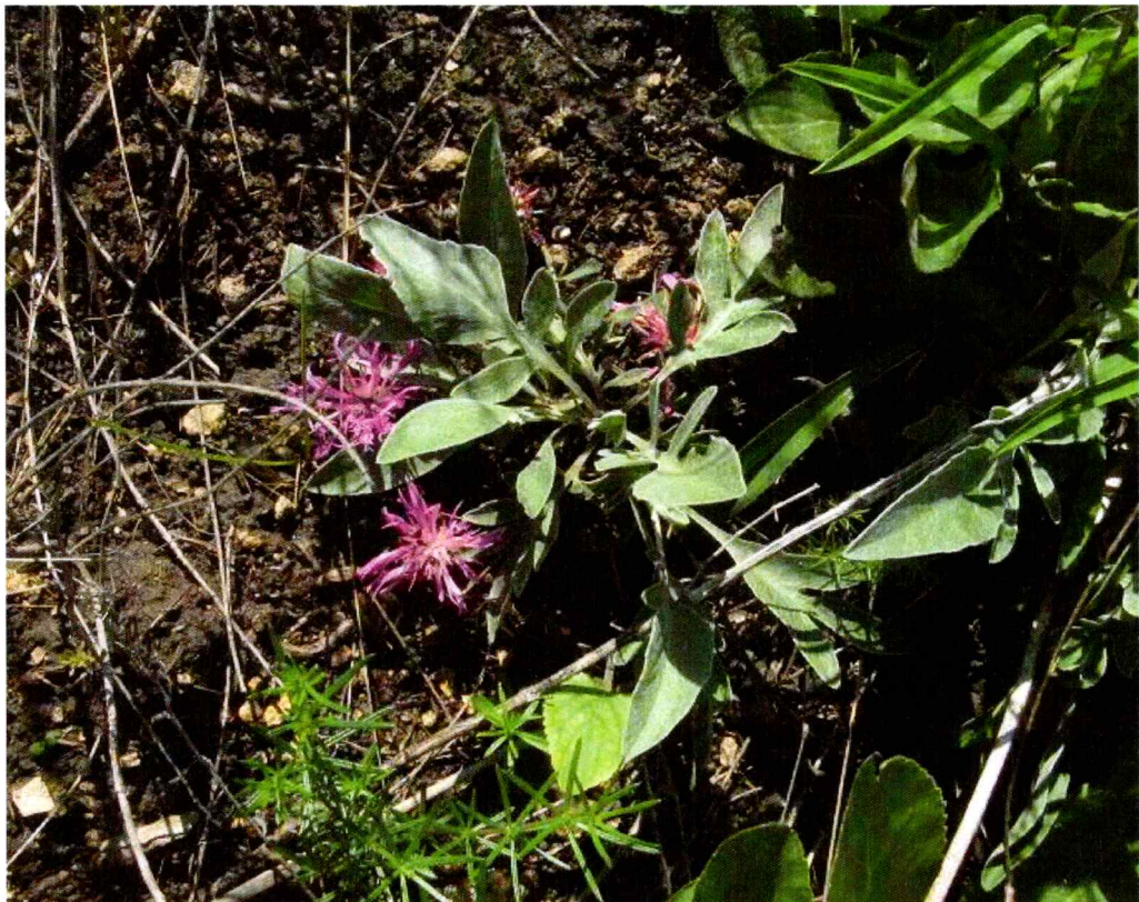
Фото 5. Василек сумской