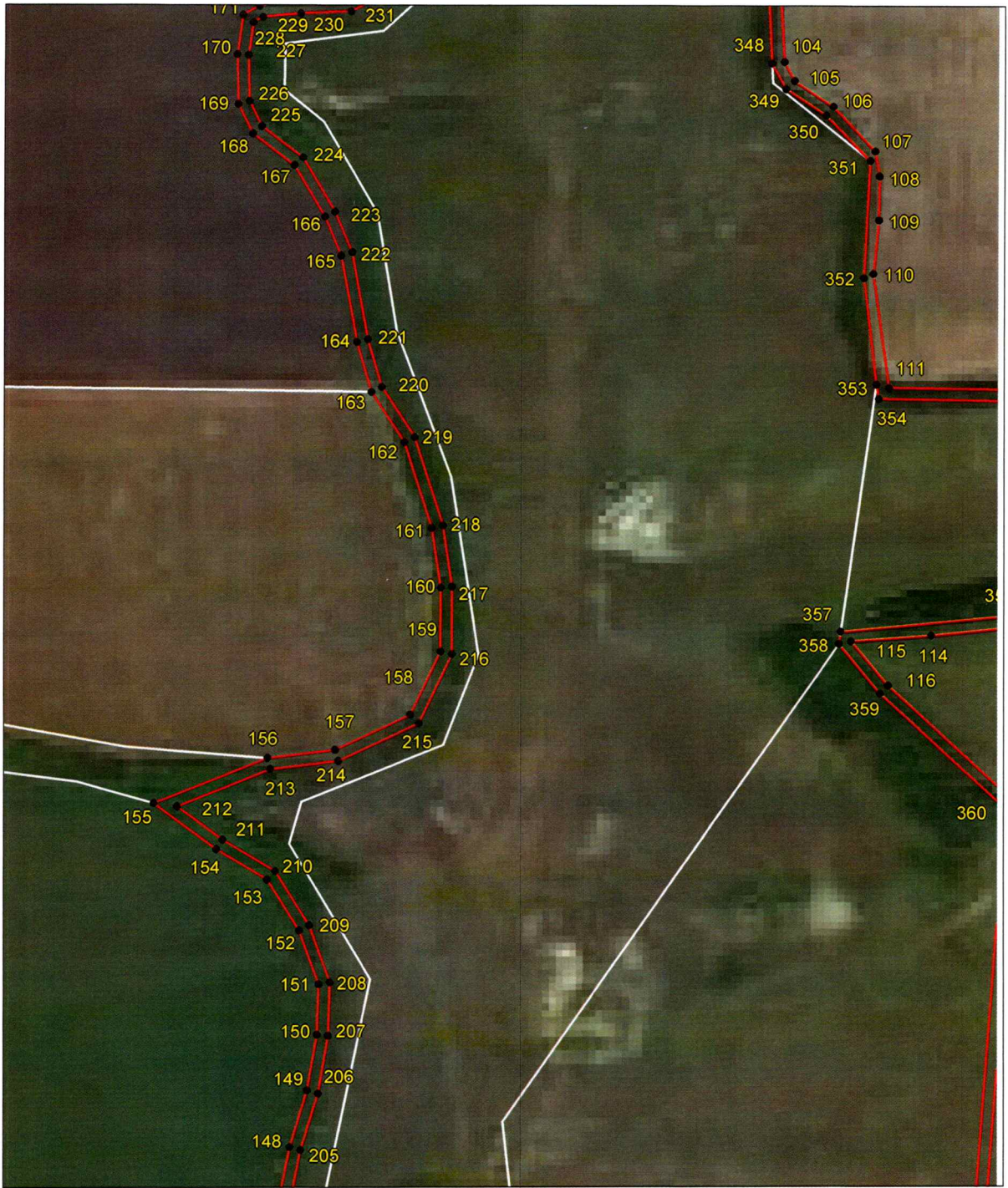
Выносной лист 5