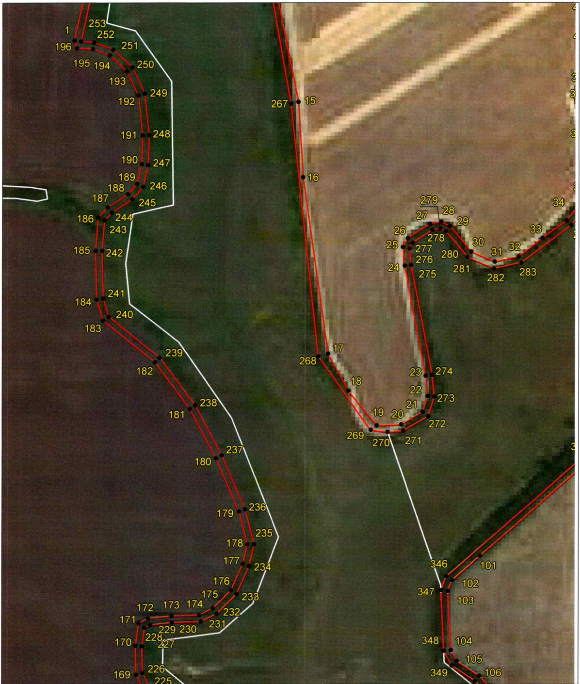
Выносной лист 1