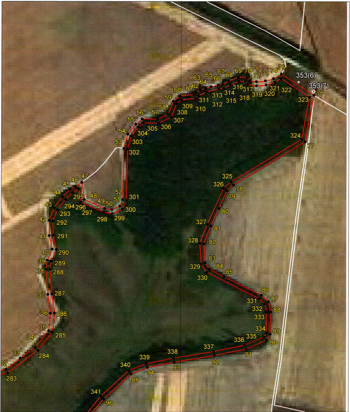
Выносной лист 3