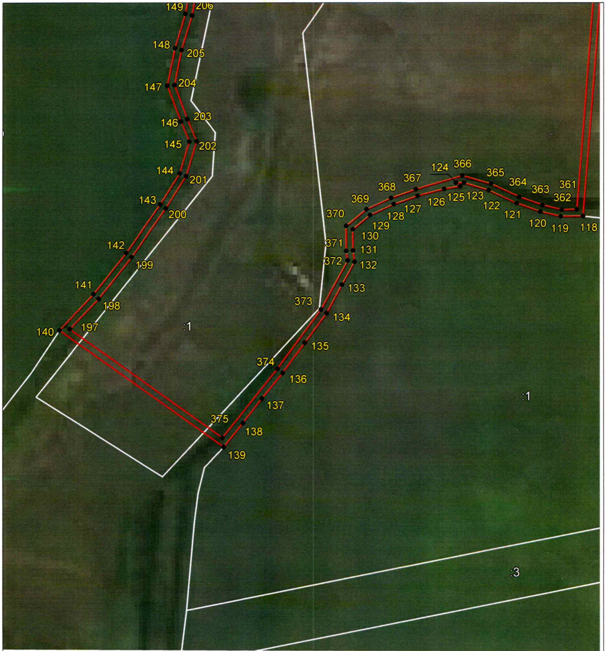
Выносной лист 7