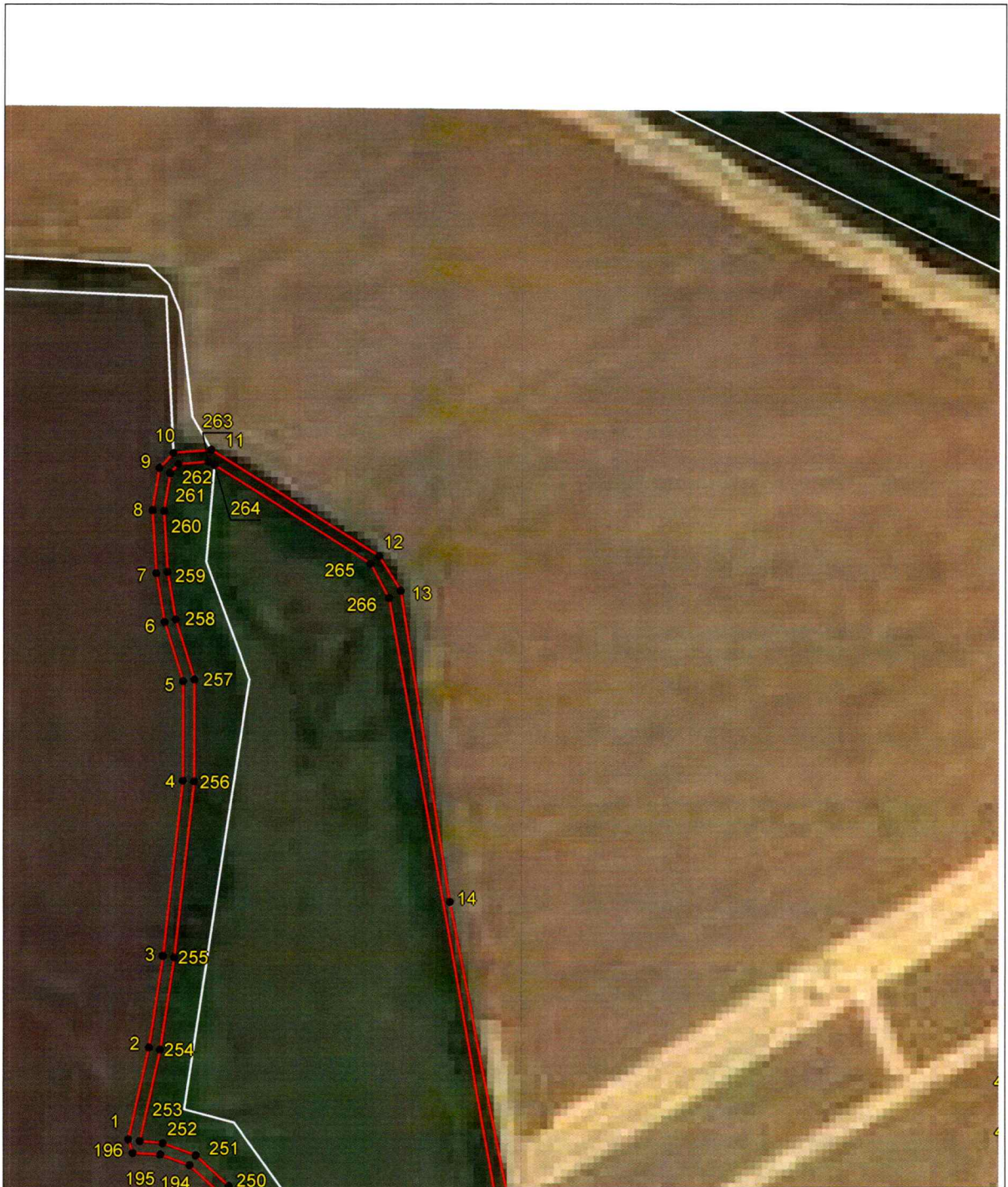
Выносной лист 2