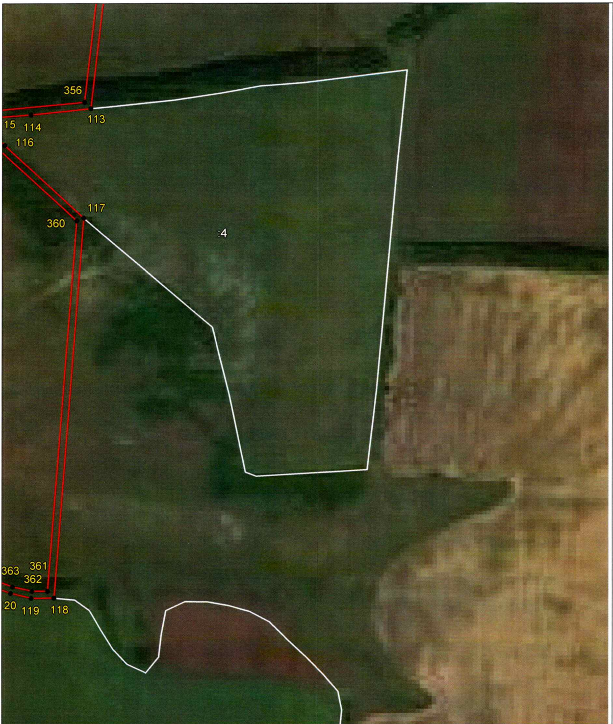
Выносной лист 6