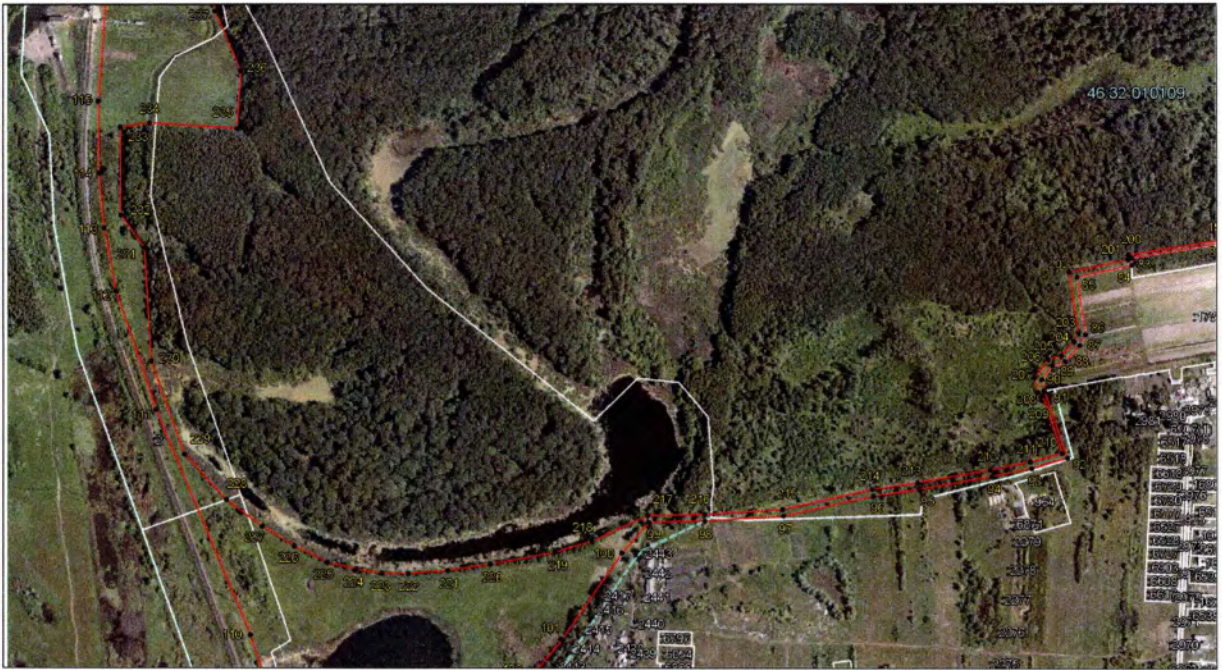
Выносной лист 3