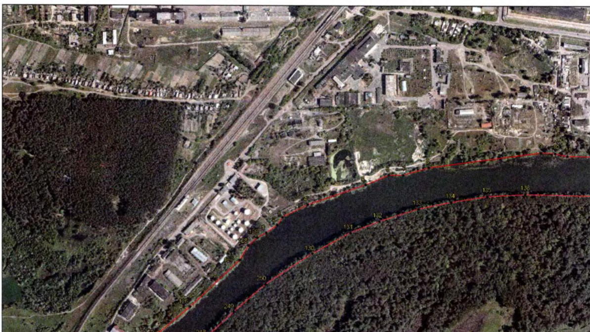
Выносной лист 1