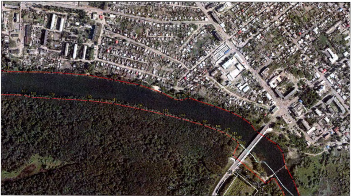
Выносной лист 5