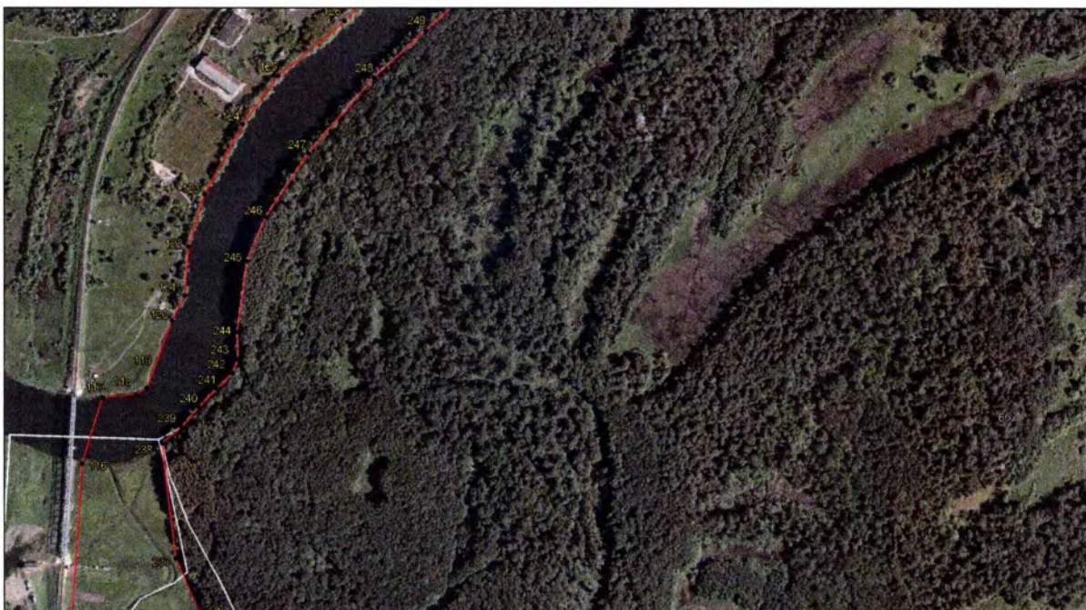
Выносной лист 2