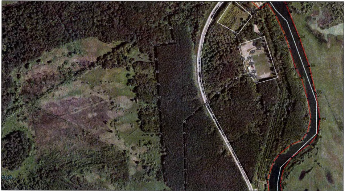
Выносной лист 6