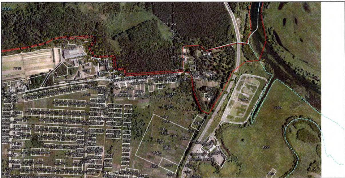
Выносной лист 7