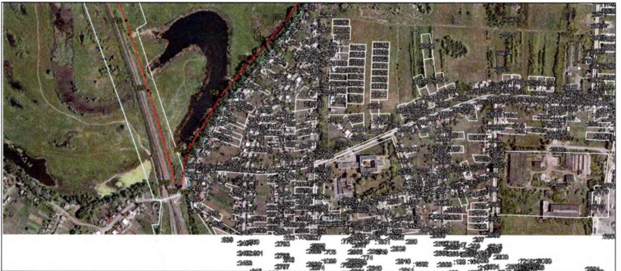
Выносной лист 4