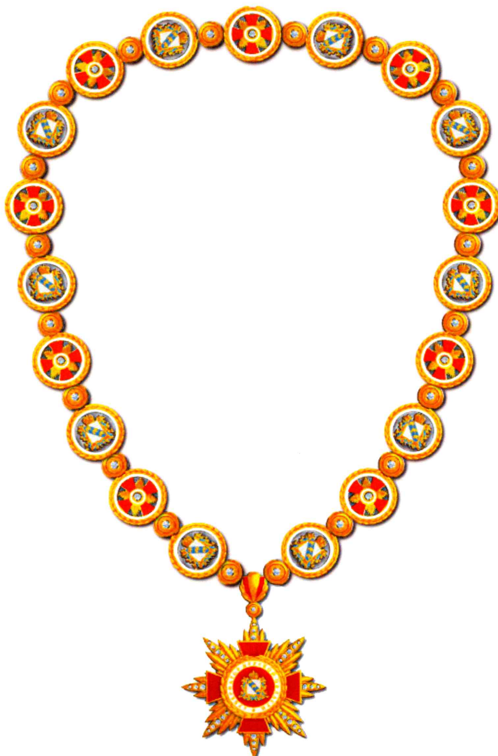
Рисунок Знака Губернатора Курской области