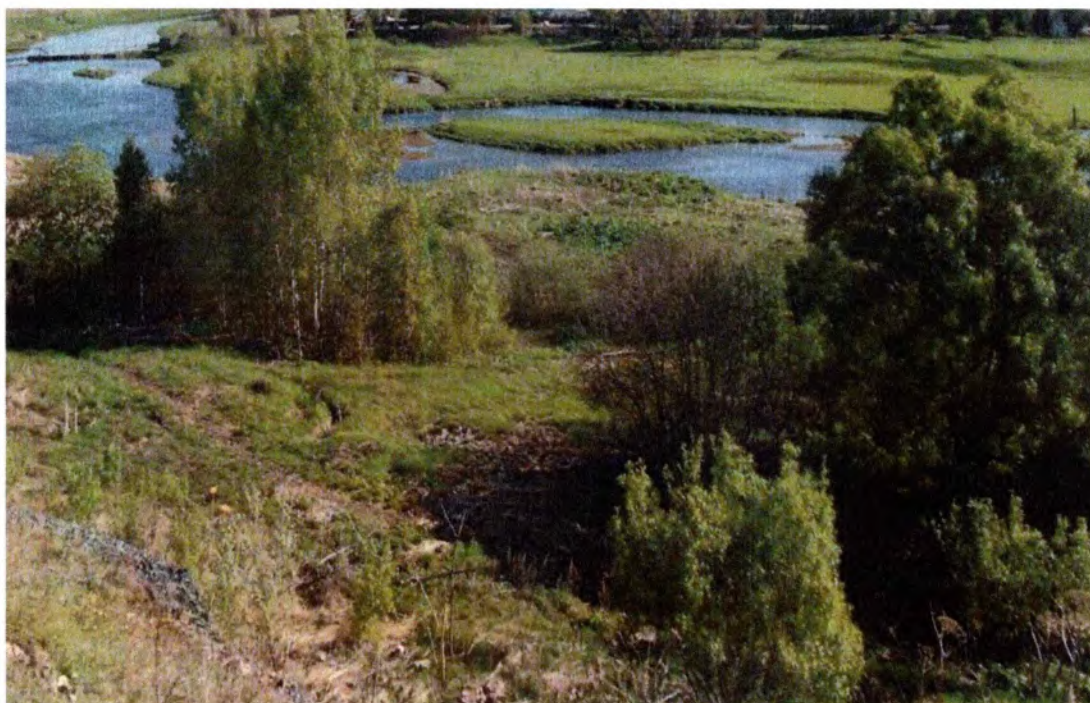
Фото 1. Вид на реку Обеста (1-й участок)