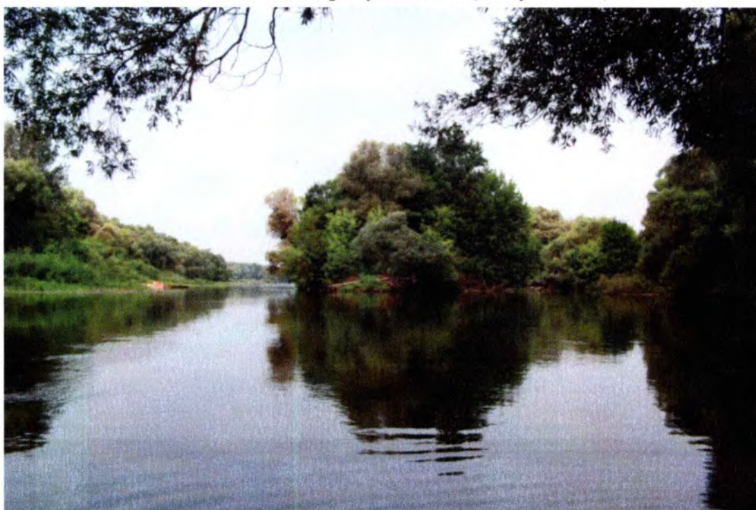
Фото 2. Вид на реку Клевень (2-й участок)