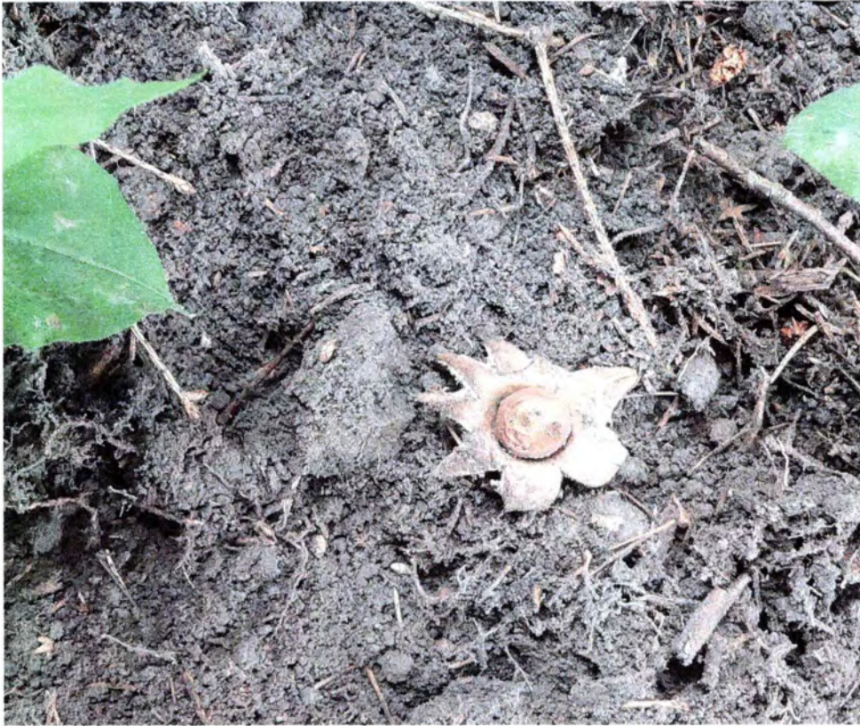
Фото 5. Гриб звездовик бахромчатый