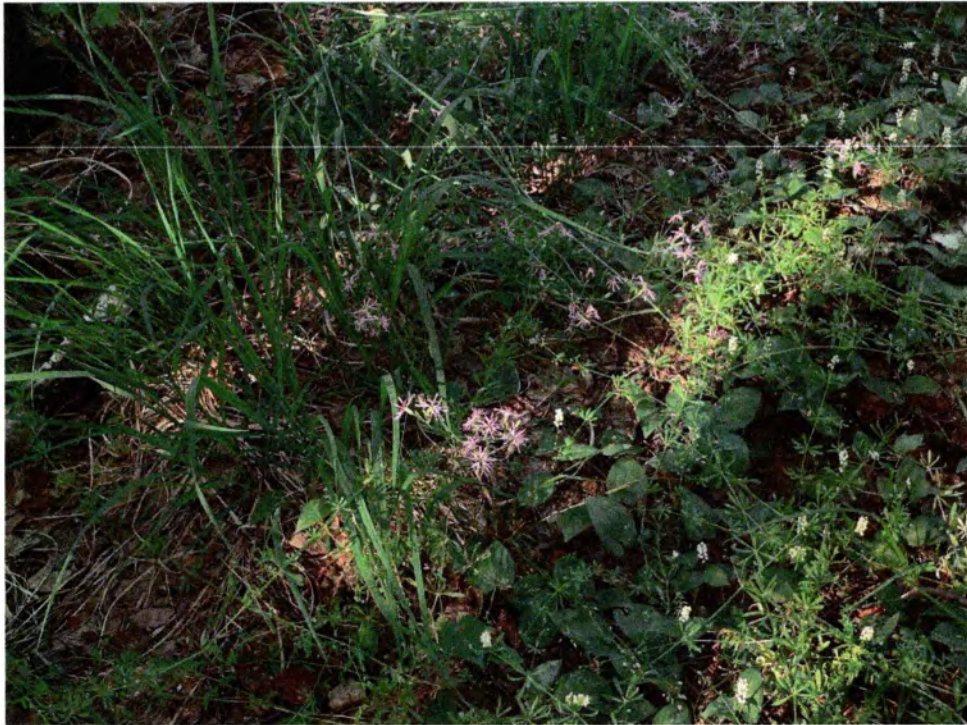
Фото 6. Гвоздика пышная и майник двулистный