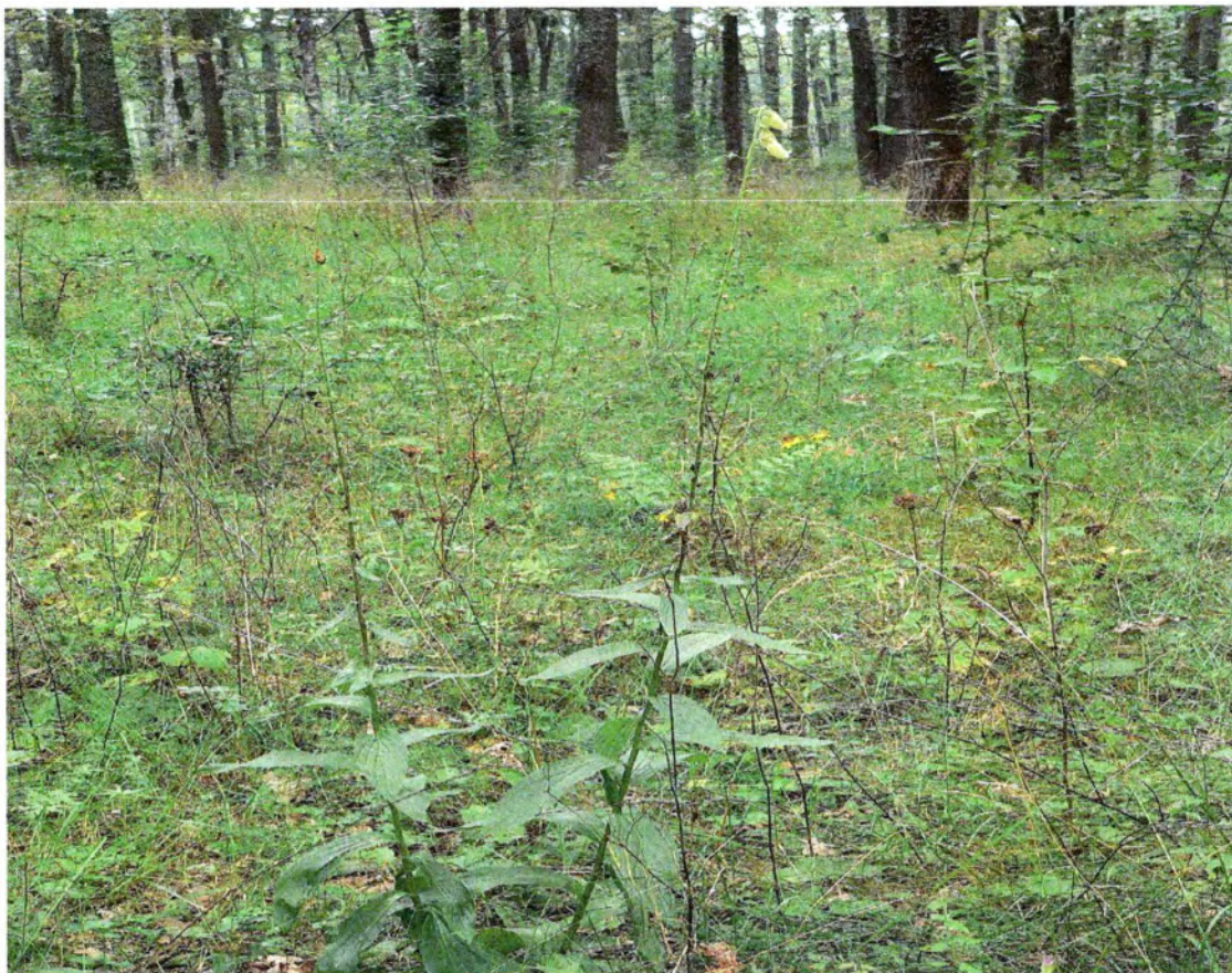
Фото 3. Наперстянка крупноцветковая