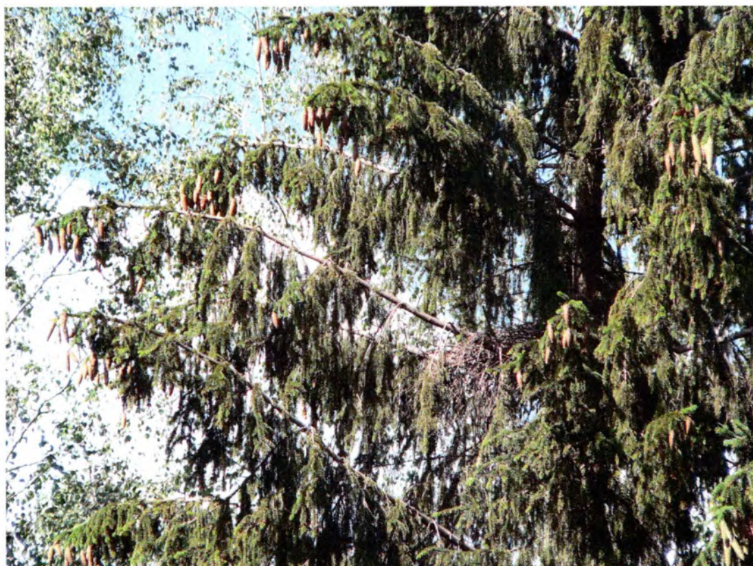
Фото 4. Гнездо осоеда