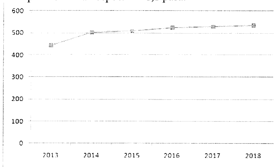
Рисунок 9. Ввод в действие жилых домов на 1000 человек населения, м 2 общей площади жилых помещений

В 2013 году в Курской области сданы в эксплуатацию жилые дома общей площадью 496,1 тыс. м 2 , в 2021 году – 565,6 тыс. м 2 . В 2013 – 2021 гг. в области введено 5,07 млн. м 2 жилья, за эти годы темпы жилищного строительства возросли в 1,1 раза.